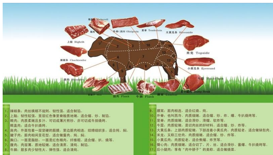
图 4.1 牛肉各部位

最复杂的是牛肉。上游为省事，牛肉就一种：牛肉。包括精肉、牛腩和附在之两者上的肥肉和油。