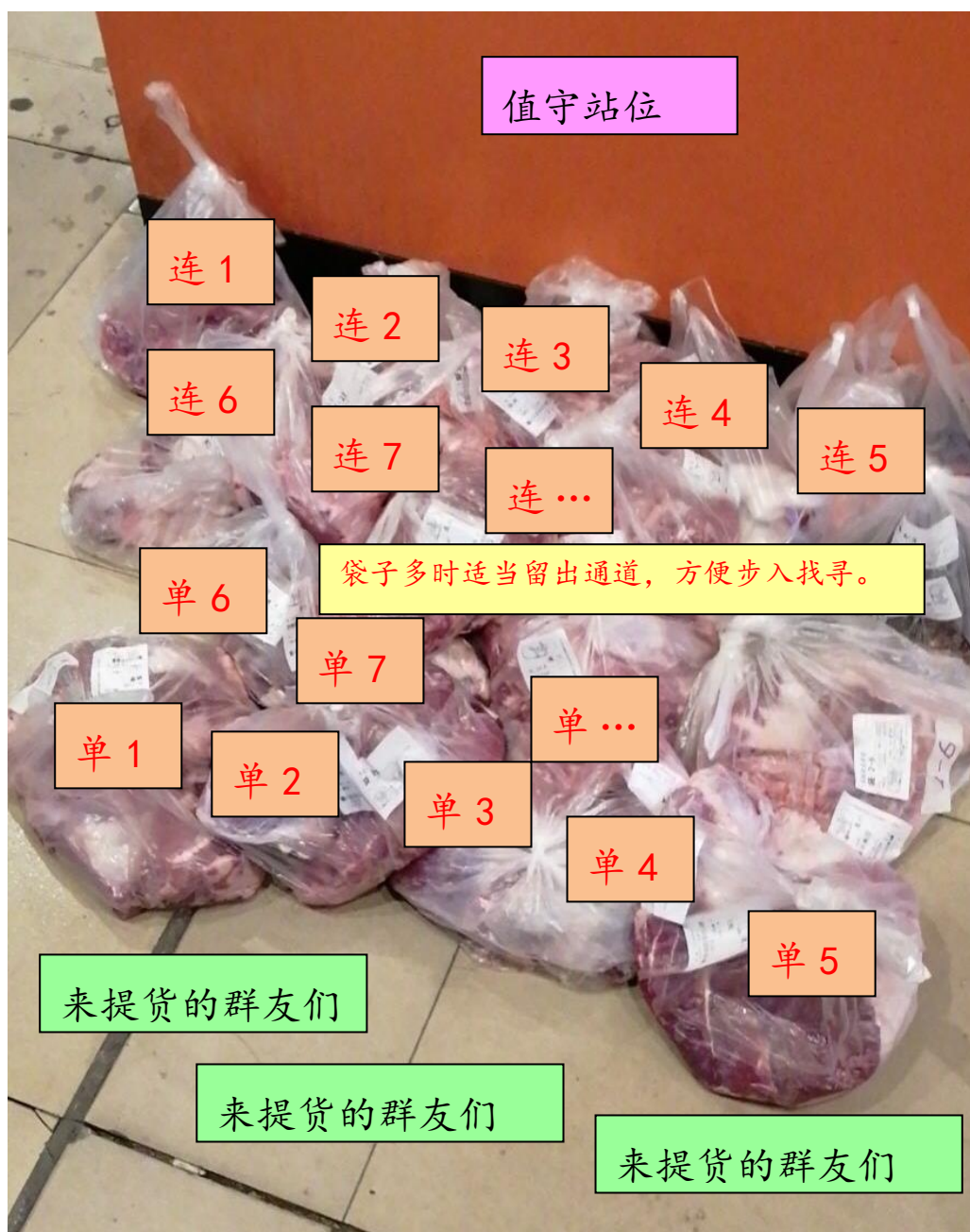
图 4.2 提货点袋子摆放标准

还有是提货时，请高素质的群友帮值守志愿者摆一下各袋的位置，也为后来的同学能更快地找到自己的货。从27期开始，每个袋都有提货点编号，形如“单1，单2，单3……”或“连1，连2，连3……”在此以图片的示意形式规定它们的次序，若您提货时看到有乱的，顺手调一下它们的顺序，让它们趋向有序就行：