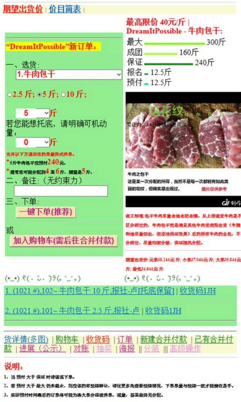
图 3.3 bbltg.net 首页上的选购器